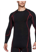
ラインに同系色では 無い色がついてる