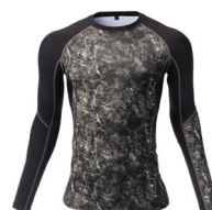
模様がある。単色ではない。