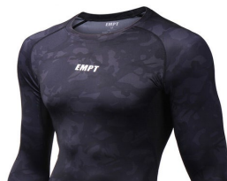
模様があるが 単色と認定できる