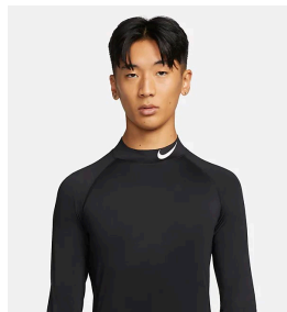
ロゴが入っている