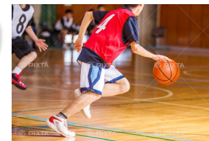
コンプレッション系の ウェアではない